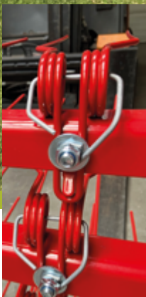
Spin-Rake model 200

De verticale pennetjes bevatten een 'knik' en zijn daardoor zeer flexibel. Hierdoor kunnen ze alle kanten op bewegen. Door de draaiende beweging van de pennetjes wordt het onkruid weggehaald, terwijl het gezonde gras blijft staan. Meerdere werkgangen over hetzelfde traject zijn mogelijk. De pennen nemen geen materiaal mee, omdat ze zichzelf schoondraaien.